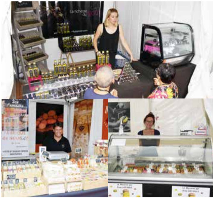
EN/ CABINET OF CURIOSITIES

A tomber à la renverse: les macarons au goût Mojito ou les Snickers de chez Mic Mac Macaron. (Ekaterina)