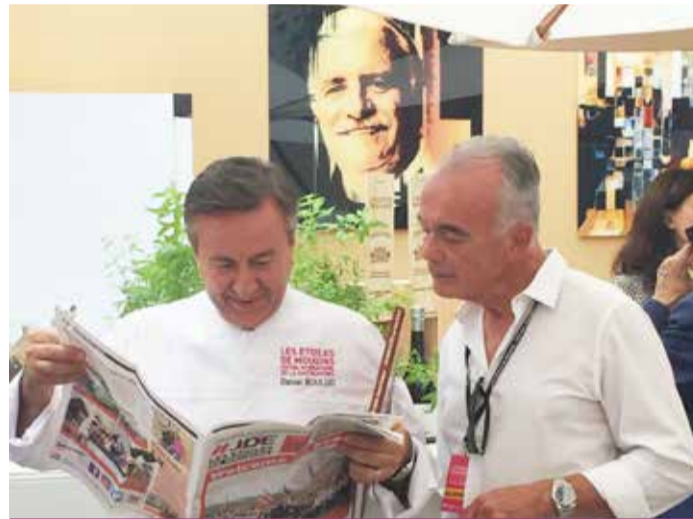
Le JDE : tout le monde le lit !