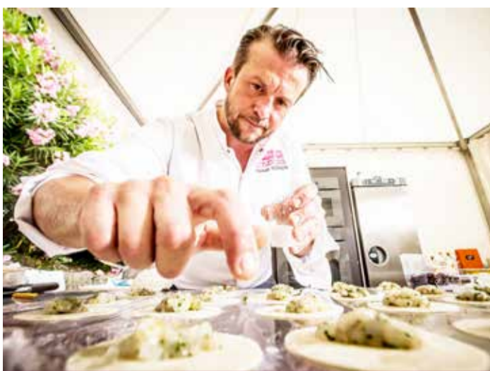
La main à la pâte