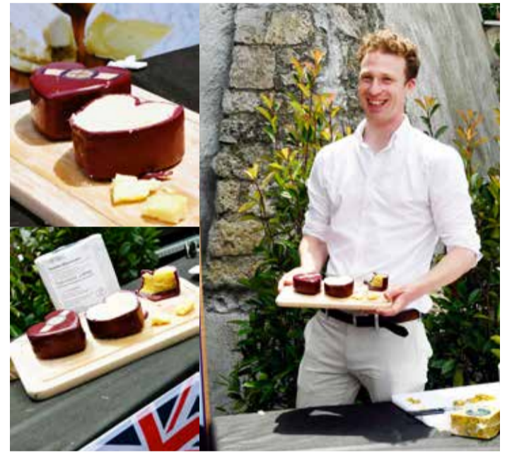
EN/ NO BREXIT FOR CHEDDAR

Le plus célèbre des fromages...anglais fait un carton sur la Côte. Celui là, affiné 12 mois, est bio, au lait de vache pasteurisé. La Godminster qui le commercialise en a fait son beurre en livres sterling chez Metro. (Thierry Bourgeon)