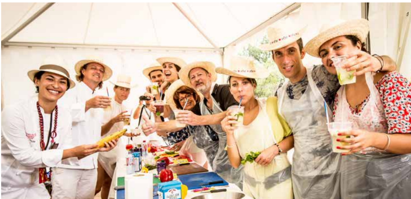
Sans soif et sans reproche