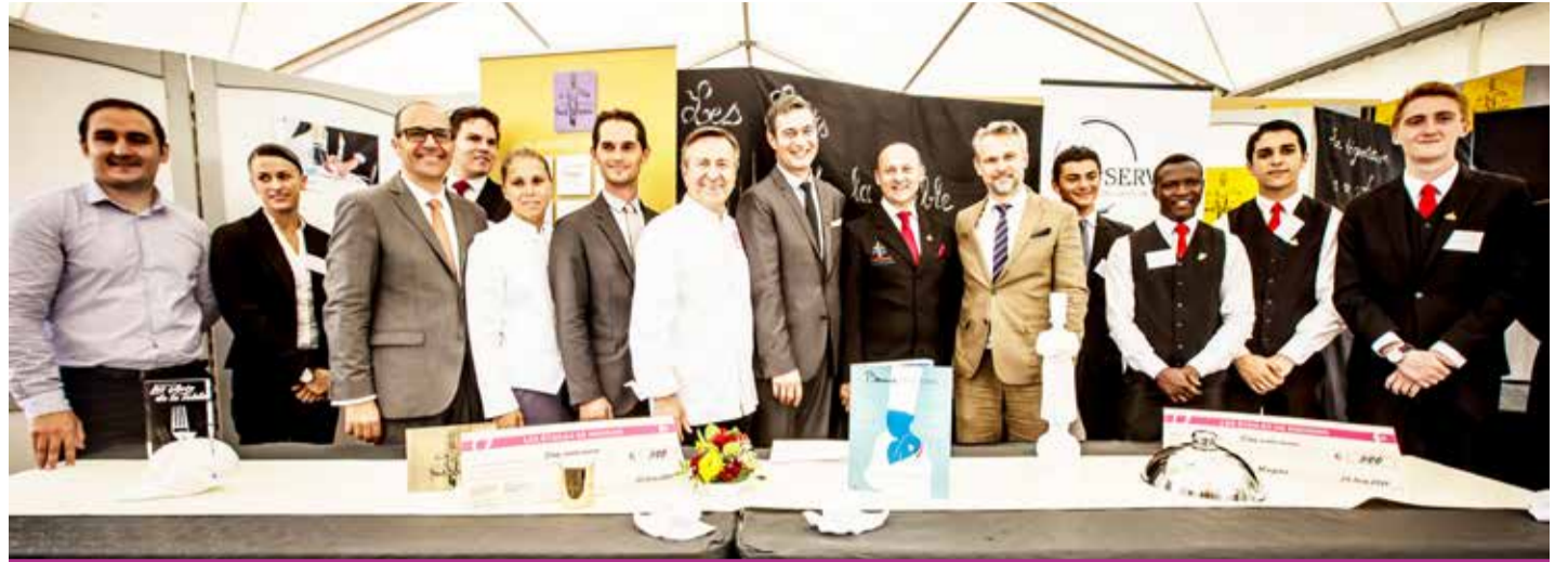
Remise des prix au concours Art de la table