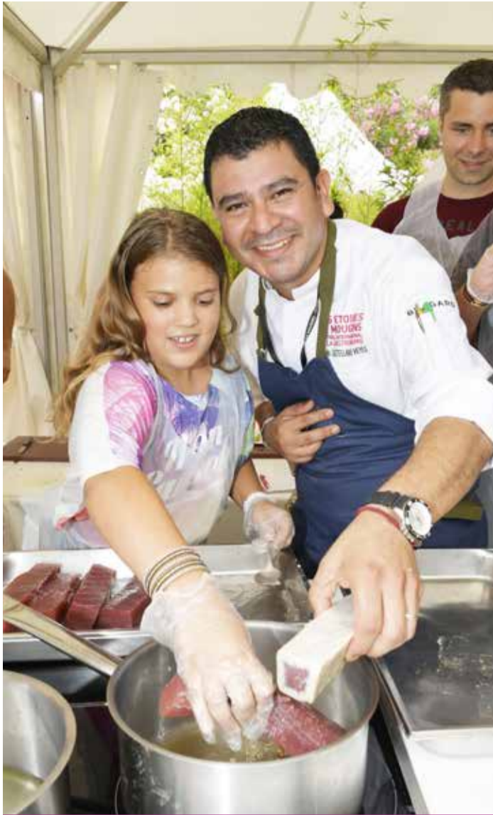
Transmission de pensée