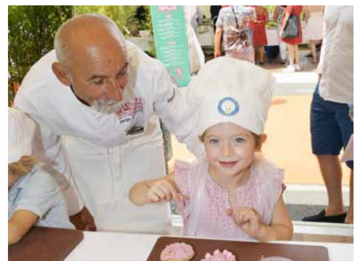
Choc des générations