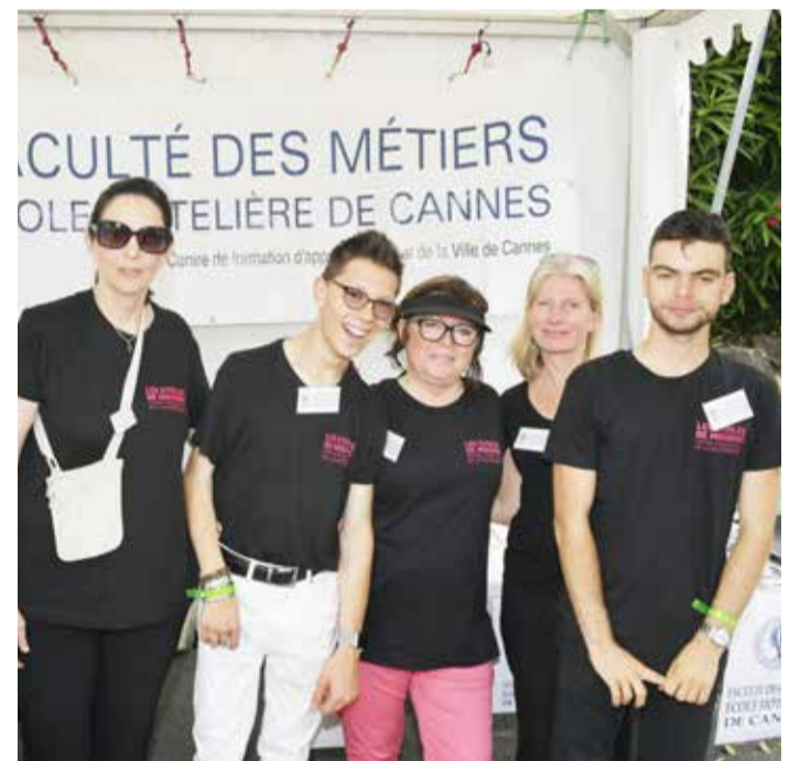
Quel accueil aux étoiles : merci <3